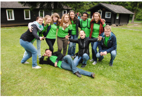
Jugendleiter:in beim Musikcamp