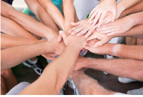
Beim Kongress gemeinsam neue Ideen entwickeln

Der Kongress für Jugendleitungen ist ein Angebot, das zum einen der Vernetzung von Jugendleitungen aus dem gesamten Verbandsgebiet dient, aber auch aktuelle Themen rund um die Vereins- und Jugendarbeit aufgreift. Beim Kongress erhalten die Teilnehmenden durch den Austausch und durch verschiedene Workshops, Denkanstöße und Hilfen für eine erfolgreiche und zukunftsorientierte Vereinsarbeit. Gleichzeitig motiviert die Teilnahme am Kongress zur ehrenamtlichen Mitarbeit im Verein. Im gemeinsamen Austausch entstehen meist neue Ideen, die die Stützen einer auch in zukünftig erfolgreichen Vereins- und Verbandsarbeit in der Bläserjugend ist. In der Vergangenheit fand der eintägige Kongress im Zweijahres-Rhythmus in Geiselwind, aber auch schon zweitägig als Online-Kongress statt. In Zukunft sind auch zweitägige Kongresse in Präsenz geplant.