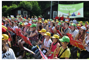
Abschlusskonzert auf dem Campgelände

Das Nordbayerische Musikcamp ist ein einwöchiges Ferienangebot in der ersten Pfingstferienwoche (Dienstag - Samstag) für Kinder und Jugendliche zwischen 10 und 15 Jahre aus den Mitgliedsvereinen der NBBJ. Im Jahr 2014 fand das erste Nordbayerische Musikcamp statt. Das Camp zeichnet sich durch eine bunte Mischung an Musik- und Workshop-Angeboten aus. Jungen Verbandsmitgliedern wird in dieser Woche die Möglichkeit gegeben, ihr Hobby Musik mit anderen Gleichaltrigen zu erleben und zu teilen. Am Ende des Camps findet ein großes Abschlusskonzert statt, bei dem die jungen Musiker:innen, Eltern, Bekannten und Interessierten die in der Woche geprobt Stücke präsentieren. Das Camp ist für 120 Kinder und Jugendliche ausgelegt. Durch die Maßnahme macht die NBBJ zudem auf sich als Jugendverband aufmerksam und gewinnt oft engagierte Nachwuchsmusiker:innen für die verbandliche Jugendarbeit. Die Ferienfreizeit wird von der Geschäftsstelle geleitet und mit großer Unterstützung von Jugendleiter:innen geplant und durchgeführt.