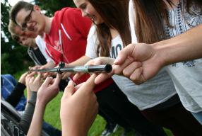
Jugendarbeit macht Spaß

Du bist schon längst als Jugendleitung aktiv und konntest bestimmt in der Praxis auch schon einiges an Erfahrungen in der Arbeit mit Kindern und Jugendlichen sammeln. Mit der bundesweit anerkannten Juleica-Ausbildung können sich du und andere Interessierte aus deinem Kreis oder Bezirk zudem als ausgebildete:r Mitarbeiter:in der Jugendarbeit gegenüber Eltern, Teilnehmenden, Gesellschaft und Politik ausweisen. Die Ausbildung nach festgelegten Qualitätsstandards wird von verschiedenen Trägern angeboten und durchgeführt, darunter auch von der Nordbayerischen Bläserjugend e.V.. Nach erfolgreichem Beenden der Ausbildung kannst du die Jugendleiter:innen-Card (Juleica) beantragen.